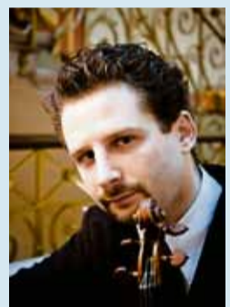
Il giovane virtuoso russo Gringolts.

sembrava piuttosto volerlo far nascere dall'impasto timbrico dell'orchestra, cercando inoltre di fondere il proprio fraseggio con quello degli altri strumenti (spesso si rivolgeva al primo violino quasi a uniformare le arcate: non a caso sta intensificando l'attività col quartetto che ha fondato). Il risultato è prezioso perché non sviscila la bellezza della parte solistica ma esalta l'intima unità e la perfetta architettura di questo capolavoro.